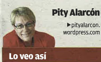
Pity Alarcón ▶pityalarcon.wordpress.com

L a Comunidad Autónoma informaba que el Servicio Murciano de Salud (SMS) ha reclamado 789.465 euros a diferentes clínicas privadas de la Región de Murcia por «un desajuste en el aprovisionamiento de material para cirugías traumatólogicas que estaban suministrando las áreas de salud, y que correspondía por contrato a los centros concertados». Y la nota continúa explicando las muchas incidencias que al parecer se han producido en este campo. Incidencias que han ocasionado un gasto, no justificado, desde 2011 a nuestros días. Y después de contar no sé cuantas cosas más, se nos dice que con estas actuaciones «se está dando respuesta a las recomendaciones del Tribunal de Cuentas, de la Intervención General y la Intervención Delegada en materia de subvenciones, contratación, conciertos, patrimonio, contabilidad, facturación, aprovisionamientos y servicios, obras, dietas y otros gastos corrientes, farma-