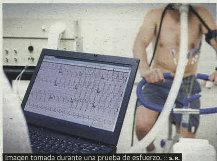
Imagen tomada durante una prueba de esfuerzo. S. R.