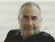
Estelas en la mar

«Si es verdad que la Semana Santa es toda una eclosión de pasión, colorido, envuelta en una belleza barroca seductora, y de clara inspiración religiosa, con el tiempo se ha ido transformando en la fiesta politeísta, de marcado carácter festivo, que poco tiene que envidiarle al desenfreno de las antiguas fiestas paganas, cuyo hueco vino a colmar interesadamente»