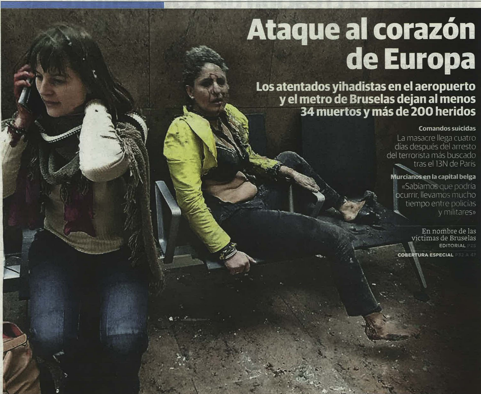
Dos mujeres heridas en el aeropuerto de Zaventem, aún bajo los efectos de la conmoción y con varios cortes en el cuerpo, intentan recomponerse tras la explosión.