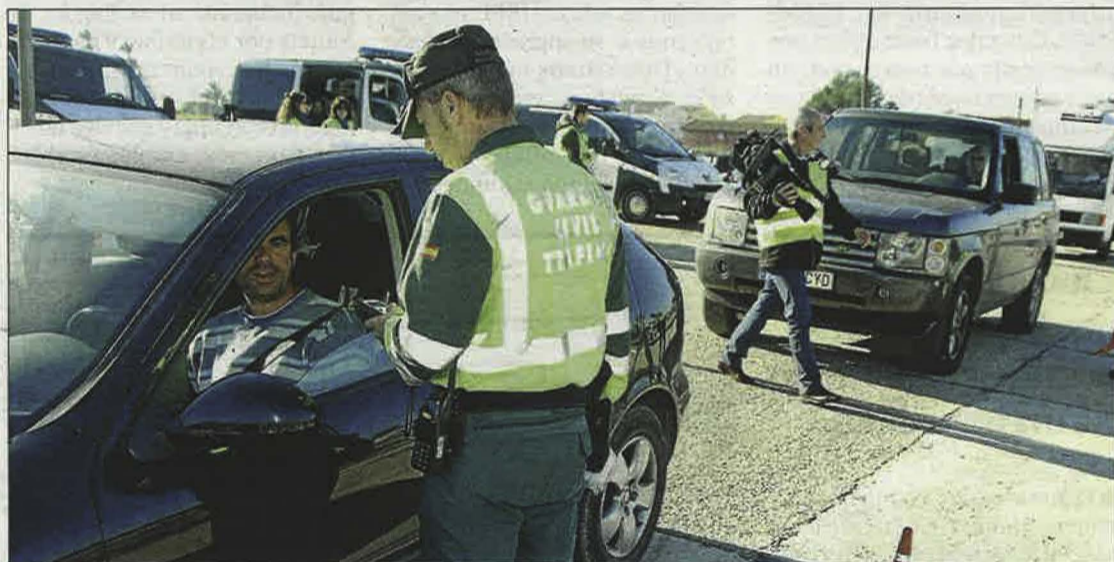
Controles de la Guardia Civil a conductores en una foto de archivo.