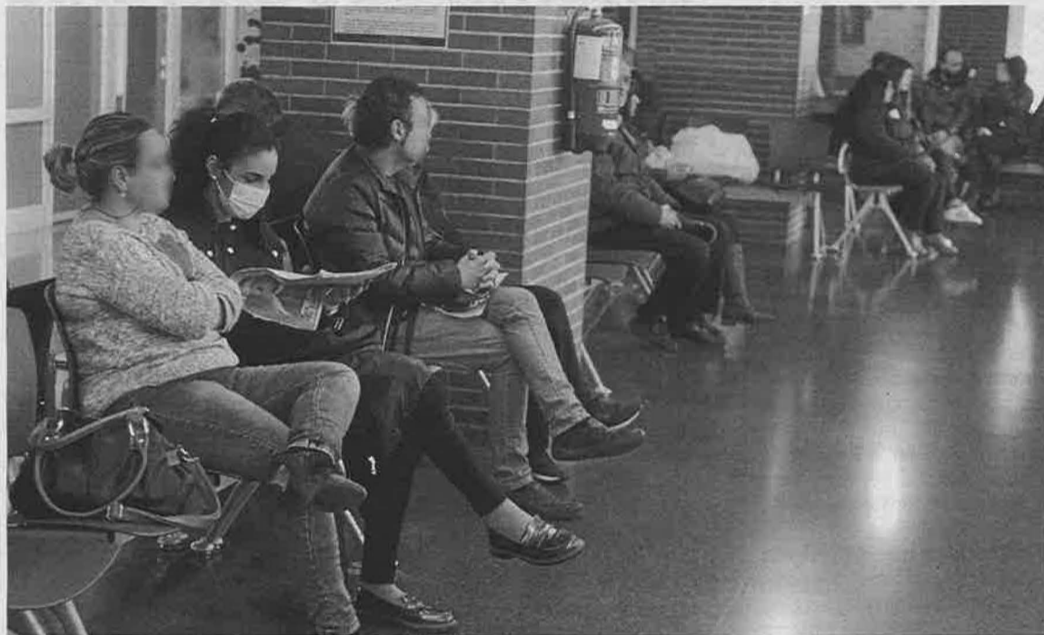
Sala de espera del servicio de Urgencias del Virgen de la Arrixaca, ayer por la mañana.

Desde que comenzó la fase ascendente de la epidemia, el pasado mes de febrero, se han registrado dos fallecimientos directamente achacables al virus. Se trata de dos mujeres de 37 y 40 años que desarrollaron complicaciones y murieron tras ingresar en la UCI. En la temporada pasada, el número de fallecimientos