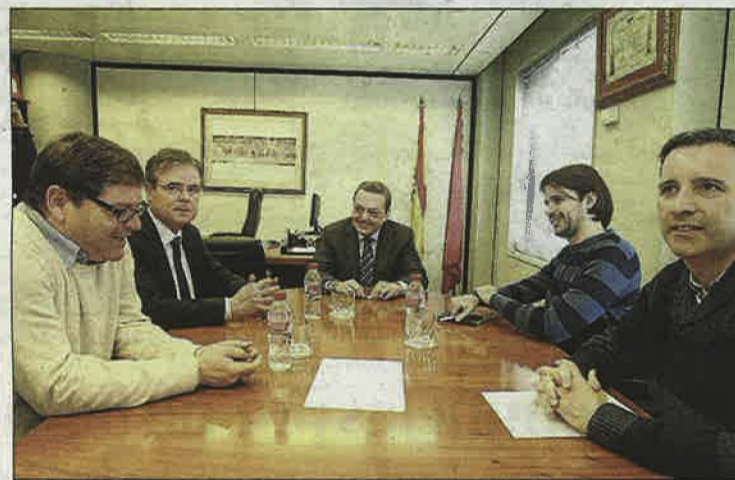
Participantes en la reunión de ayer en la patronal.